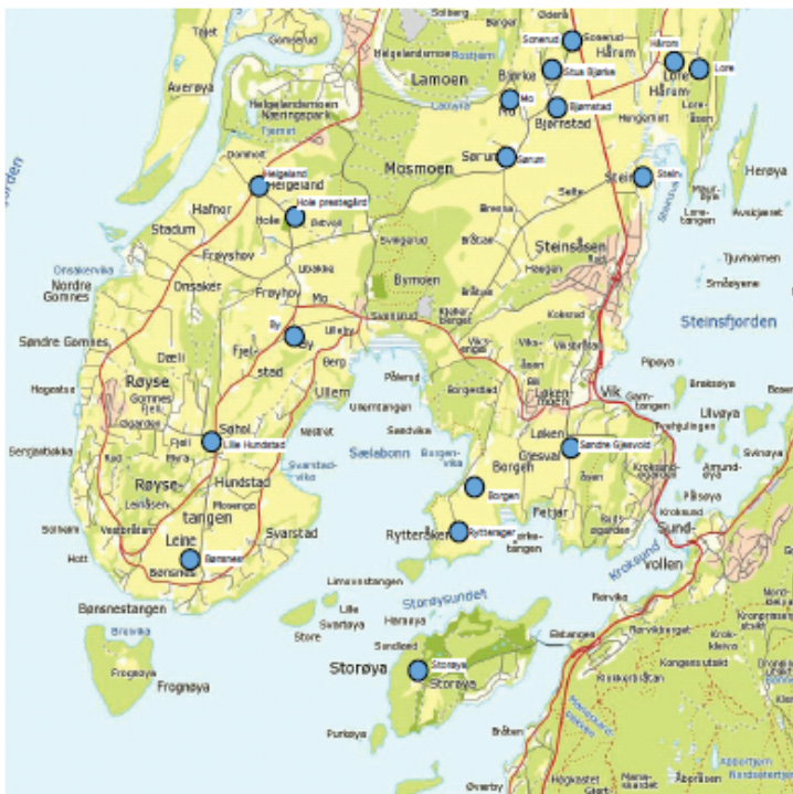
Kart utvalgte kulturmiljøer i fagrappert for nyere tid